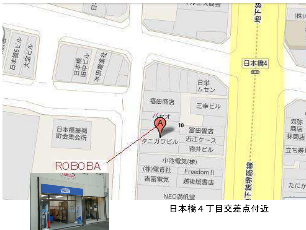
日本橋 4 丁目交差点付近